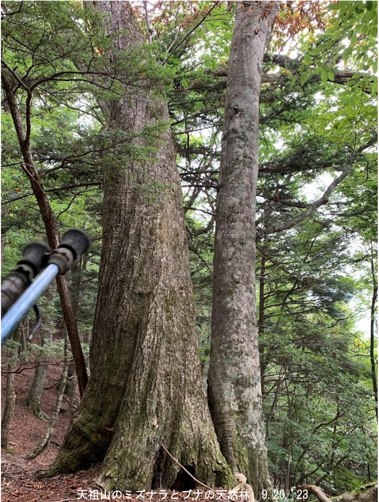
天祖山のミズナラとブナの天然林 9.20・23

標高1100m付近、冷温帯の主役ミズナラとブナの大木。東京でもっとも豊かな自然を残す日原のミズナラにもカシノナガキクイムシが媒介するナラ菌のナラ枯れが発生