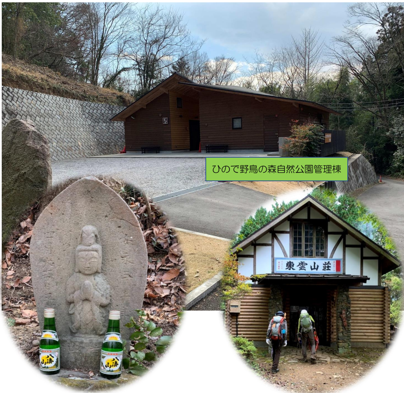
ひので野鳥の森自然公園管理棟