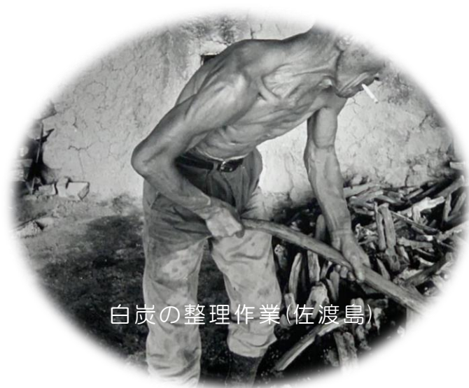
白炭の整理作業(佐渡島)

炭には白炭と黒炭の2種類がある。白炭は赤く燃え盛る1000度を超える高熱の炭を長い金属棒を使って窯の中から外へ引き出す。その上に、たっぴりと水分を含んだ炭の粉を含む灰を掛ける。そのため炭の表面には白い灰の跡が残り白炭となる。一方、黒炭は傾合いを見て窯に蓋をして空気を遮断し温度が下がるのを待つ。その後窯の入口を開け、人が中に入って蒸し焼き状態の黒炭を運び出す。黒炭は窯内の温度が700度程度と低いので白炭に比べ火もちの点では劣るが窯の中の作業は熱くてたまらない。